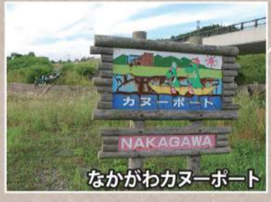
なかがわカヌーポート

詳しくは下記へ御問合せください ナポート・パーク TEL:01656-7-2680 ★ロードバイク、クロスバイク、マウンテンバイク(スパイクタイヤも有)もレンタルも用意しています!子供用もありますので、親子で一緒に楽しめます。自転車のレンタルについては、中川町観光協会(TEL:01656-8-7085)へお問合せください。